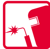
Metall- und Stahlbau