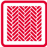
Parkett und Bodenbeläge