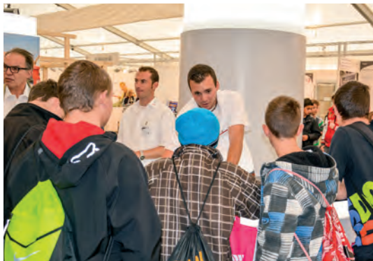
Die Jugendlichen sind sehr interessiert an der Frage, welcher Ausbildungsweg für sie der beste ist. Hier an der letztjährigen Berufsbildungsmesse.

dort auch der Verband der Bauunternehmer präsent ist. Denn die Politik – und im weiteren Sinn die Bevölkerung – müsse erkennen, wie wichtig die duale Ausbildung ist. Es geht nicht zuletzt um den Wohlstand der Schweiz, denn unser Land sei geprägt von vielfältigen KMU-Betrieben. Die Politik und damit indirekt auch die Kantone müssten daher differenziert vorgehen und erkennen, wo beispielsweise Einsparungen möglich sind und wo solche Einsparungen unangebracht oder vielmehr kontraproduktiv sind und den Kern der Sache, die Berufsweiterentwicklung nämlich, empfindlich treffe. Sparen in der Bildung der Menschen ist nur kurze Zeit wirklich gespart. Es muss viel investiert werden, um Bildungslücken wieder aufzuholen.