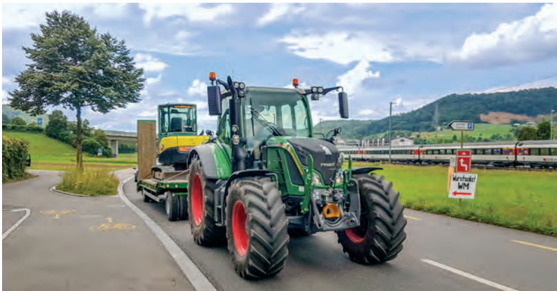
Dieser Transport dient nicht der Landwirtschaft und ist verboten. In der Praxis wird das immer wieder umgangen.

Es mag ein lokal begrenztes Problem sein, aber der Transport von Baumaschinen und Baggern mit landwirtschaftlichen Fahrzeugen ist verboten. Und das kann zudem für alle Verkehrsteilnehmer sehr gefährlich sein.