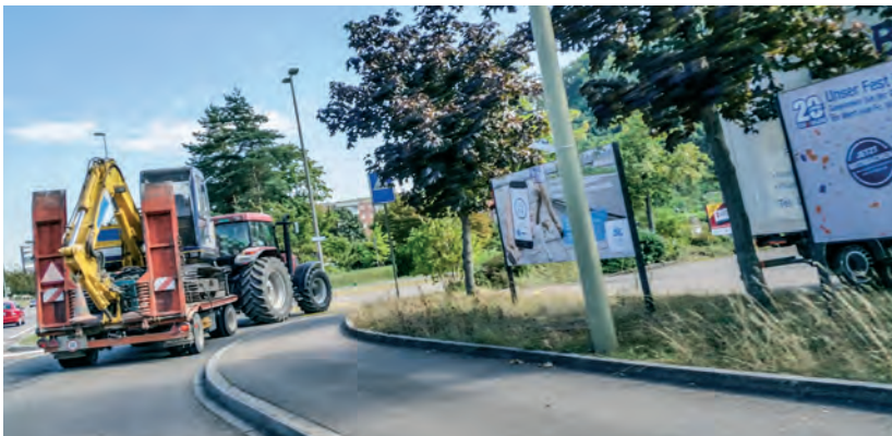
Da lauern auch immer wieder Gefahren, nicht nur in den Kurven.

(Fortsetzung von Seite 3) port der Produkte sind untersagt. Selbst Fahrten, die auf dem