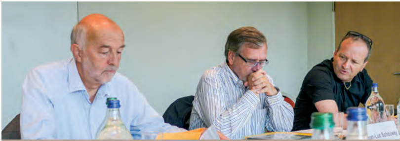
Manchmal scheint nur noch Beten zu helfen...

wird sein, wie viele Bauarbeiter Beiträge einbezahlen, was wiederum abhängig von der Baukonjunktur ist. Sollte sich letztere massgeblich verschlechtern und damit die Mitarbeiterzahlen sinken, so werden Renten im bisherigen Umfang kaum mehr zu bezahlen sein.